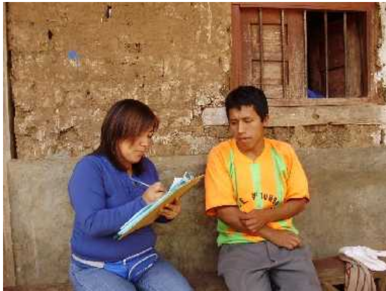
Entrevista a un beneficiario Caficultor 2