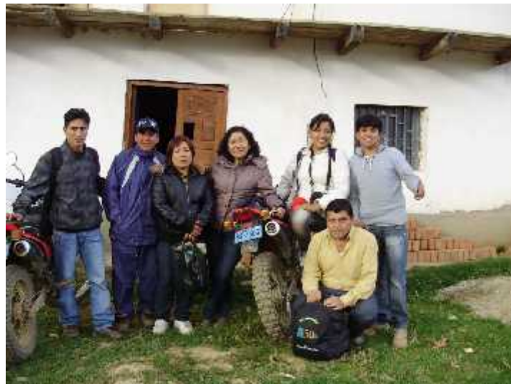
El equipo de trabajo en la ONG “Solidaridad”