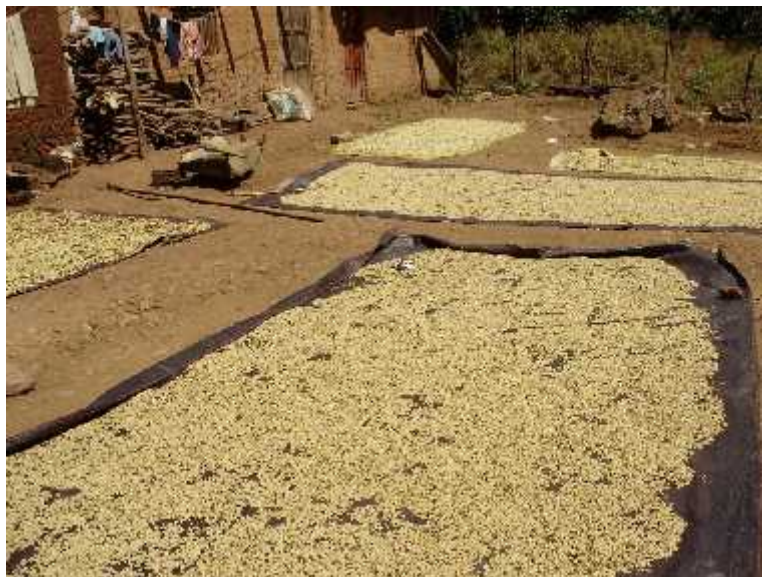
Uso del secado del café