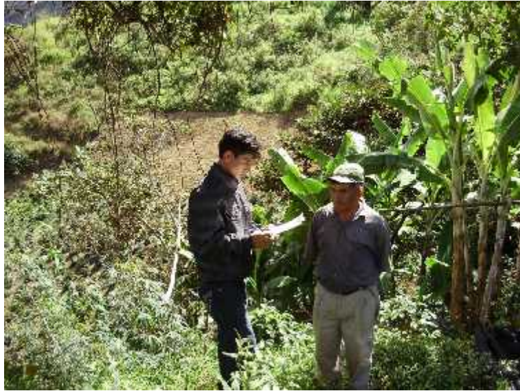
Entrevista a un beneficiario caficultor 1